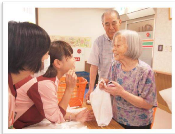
8月 園内でセブンイレブンさんの訪問販売。