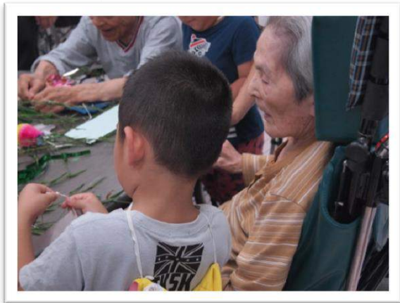
7月 新門司保育所の園児さんと一緒に七夕の飾りつけを行いました。