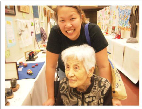
9月 シルバー文化祭に観覧にでかけました。