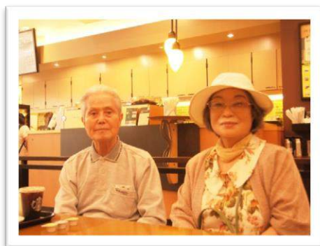
7月 サンリブシティ小倉へご家族とバスハイクへ お買い物や食事をお楽しみいただきました。