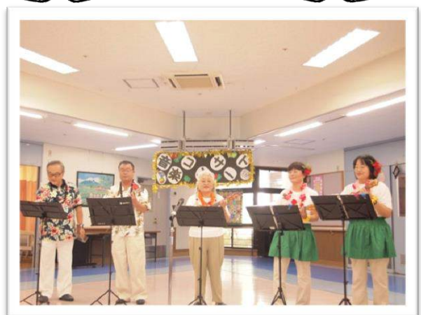
8月 メレアロハの皆さんによるウクレレ・オカリナの演奏をお楽しみいただきました。