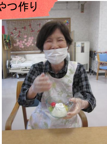
8月 皆でプリンアラモードを作りました。