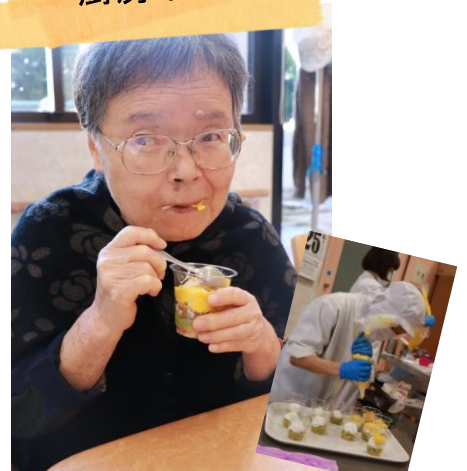
10月 厨房職員の実演おやつを美味しく頂きました。