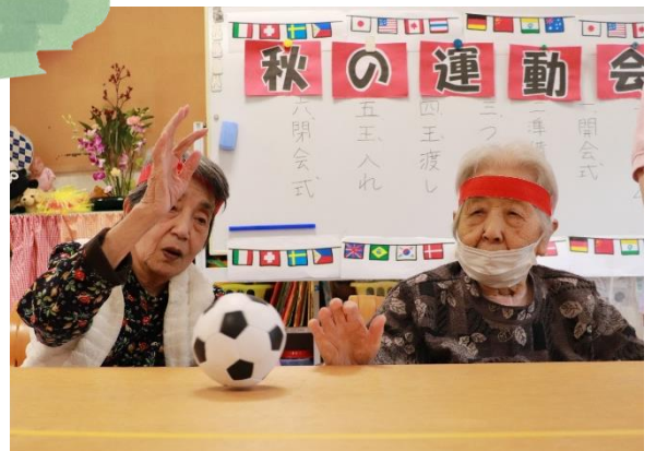
10月 スポーツの秋！色々な競技で盛り上がりました。