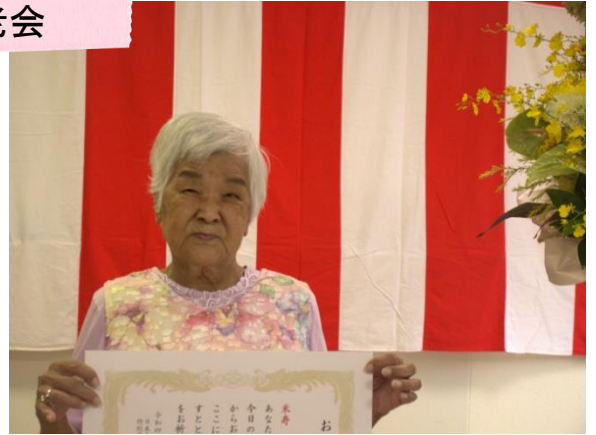
10月 敬老会で百一賀と米寿のお祝いを受けてとても喜ばれていました。